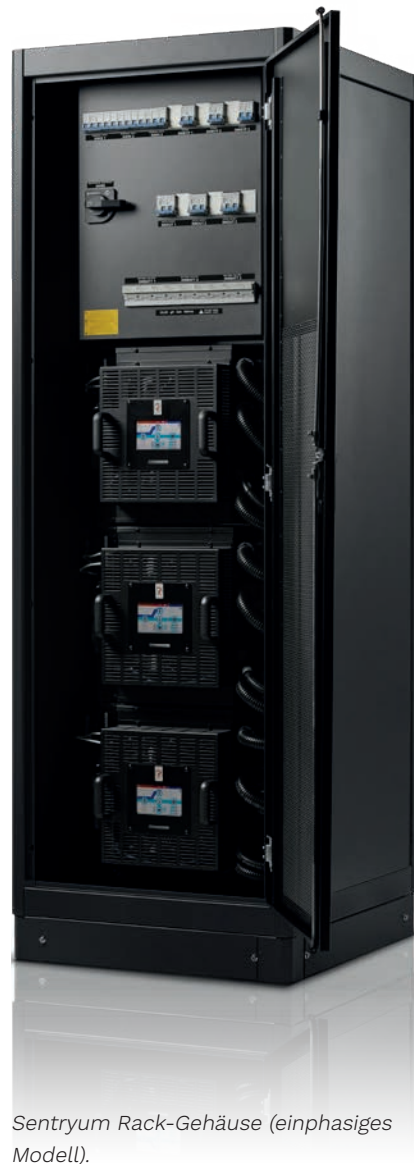
Sentryum Rack-Gehäuse (einphasiges Modell).

Spezifikation) und zyklisches Laden (zur Verminderung des Elektrolytverbrauchs und Erhöhung der Gebrauchsdauer von VRLA-Batterien);