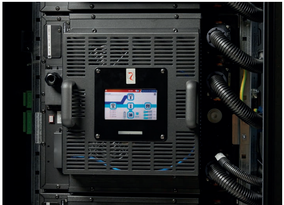
Sentryum Rack-Modul (in 19-Zoll-Gehäuse integrierte Stand-alone-Lösung) – geeignet für Installation in beliebigen 19-Zoll-Gehäusen.